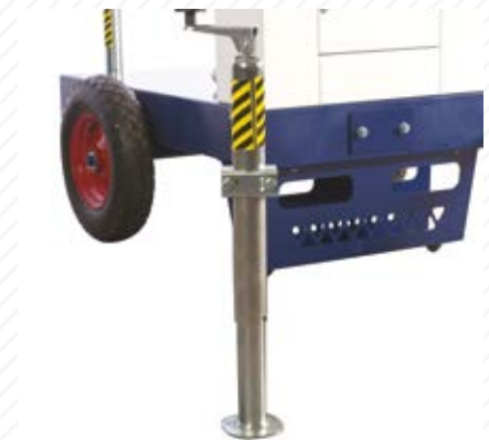
3 Stabilizzatori estraibili e ripiegabili Removable and foldable stabilizers Stabilisateurs amovibles et pliables