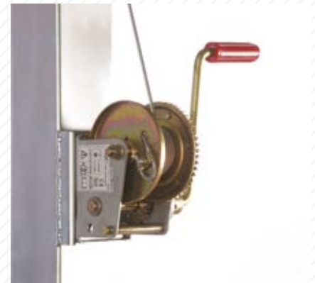
2 Verricello manuale con portata di 450kg Manual winch with 450kg weight capacity Treuil manuel avec capacité de 450kg