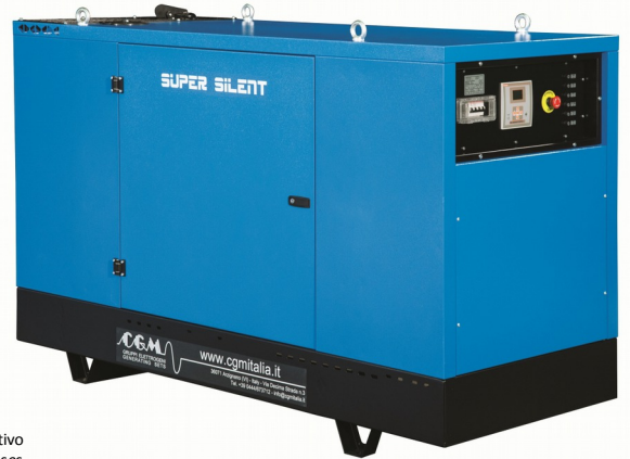
Le immagini sono puramente a titolo dimostrativo The images are only for demonstration purposes Cettes images sont utilisées uniquement à des fins de démonstration