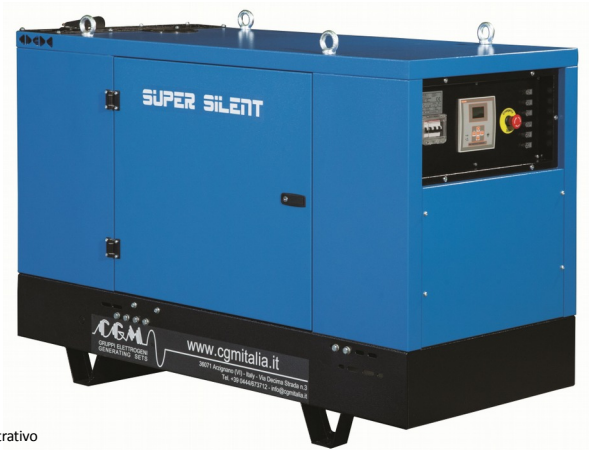
Le immagini sono puramente a titolo dimostrativo The images are only for demonstration purposes Cettes images sont utilisées uniquement à des fins de démonstration