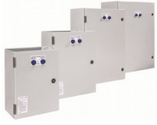
Quadro di commutazione automatica (ATS) Automatic transfer switch (ATS) TTA